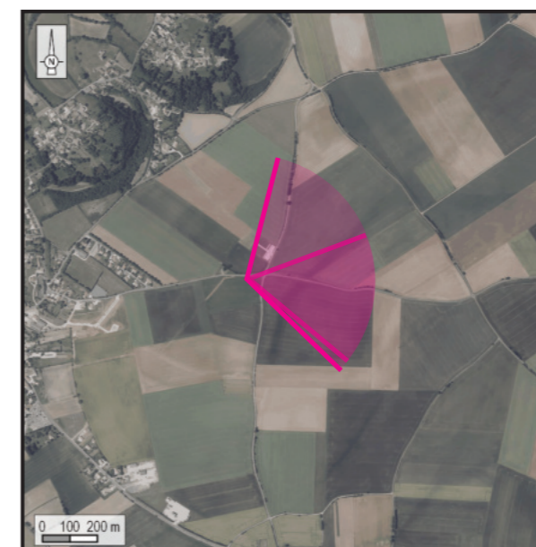
Orthophotographie 1 / 25 000